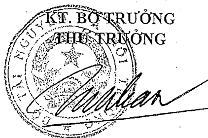
Võ Tuấn Nhân